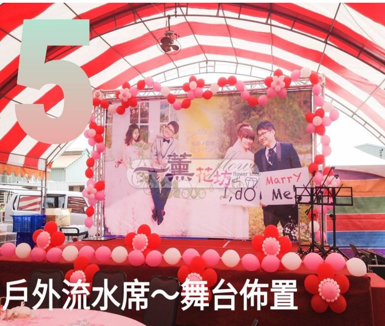
戶外流水席~舞台佈置